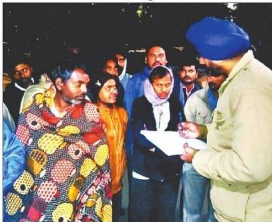
रोको टोको अभियान के तहत वेरिफिकेशन करते पुलिसकर्मी

इस दौरान अवैध तरीक से किरायेदारों को कमरा रेंट पर देना, वेरिफिकेशन नहीं होने वाले 119 लोगों को हिरासत में लेते हुए 50 वाहनों को कब्जे में लिया। संबंधित थाना पुलिस ने