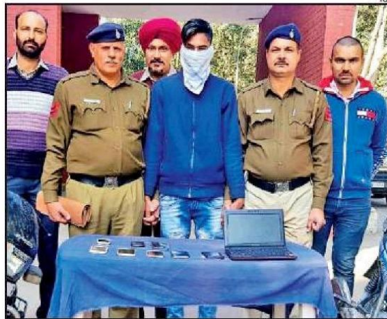
IN POLICE NET: The accused in police custody